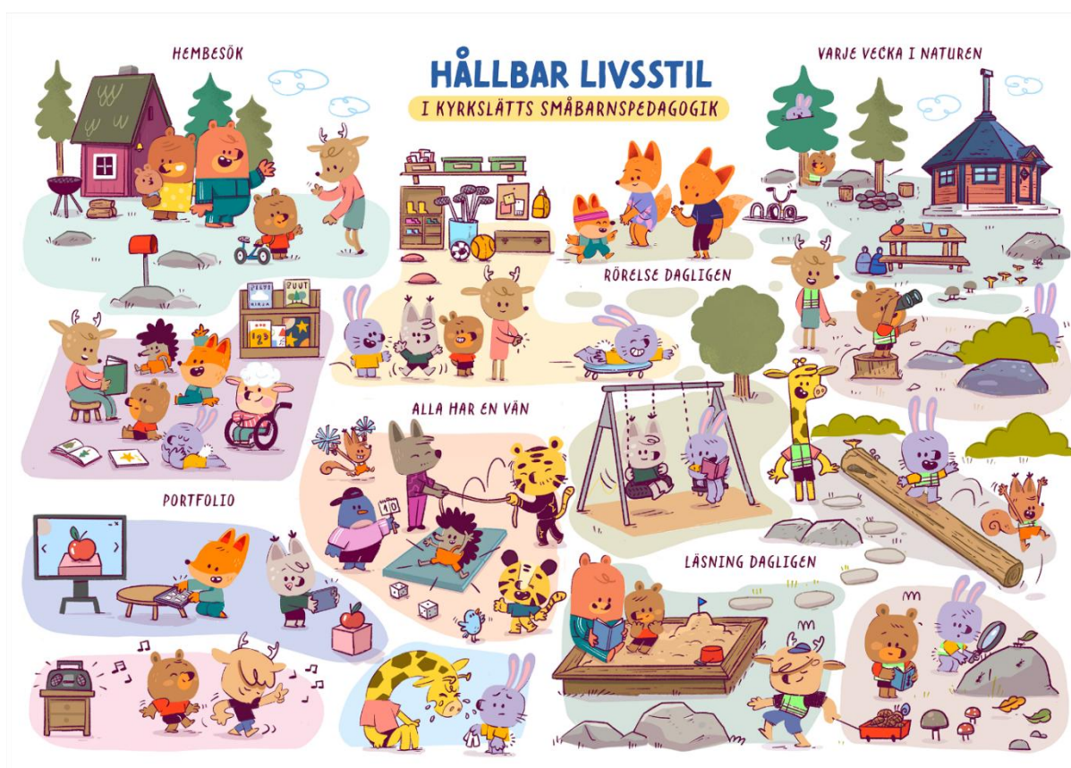
Figur 1. Hållbar livsstil i Kyrkslätt småbarnspedagogik (kvalitetslöften)

Utgångspunkten och målet för verksamhetskulturen inom småbarnspedagogiken i Kyrkslätt är att främja en uppväxt mot en hållbar livsstil. För att stöda en hållbar livsstil har vi utarbetat sex kvalitetslöften.