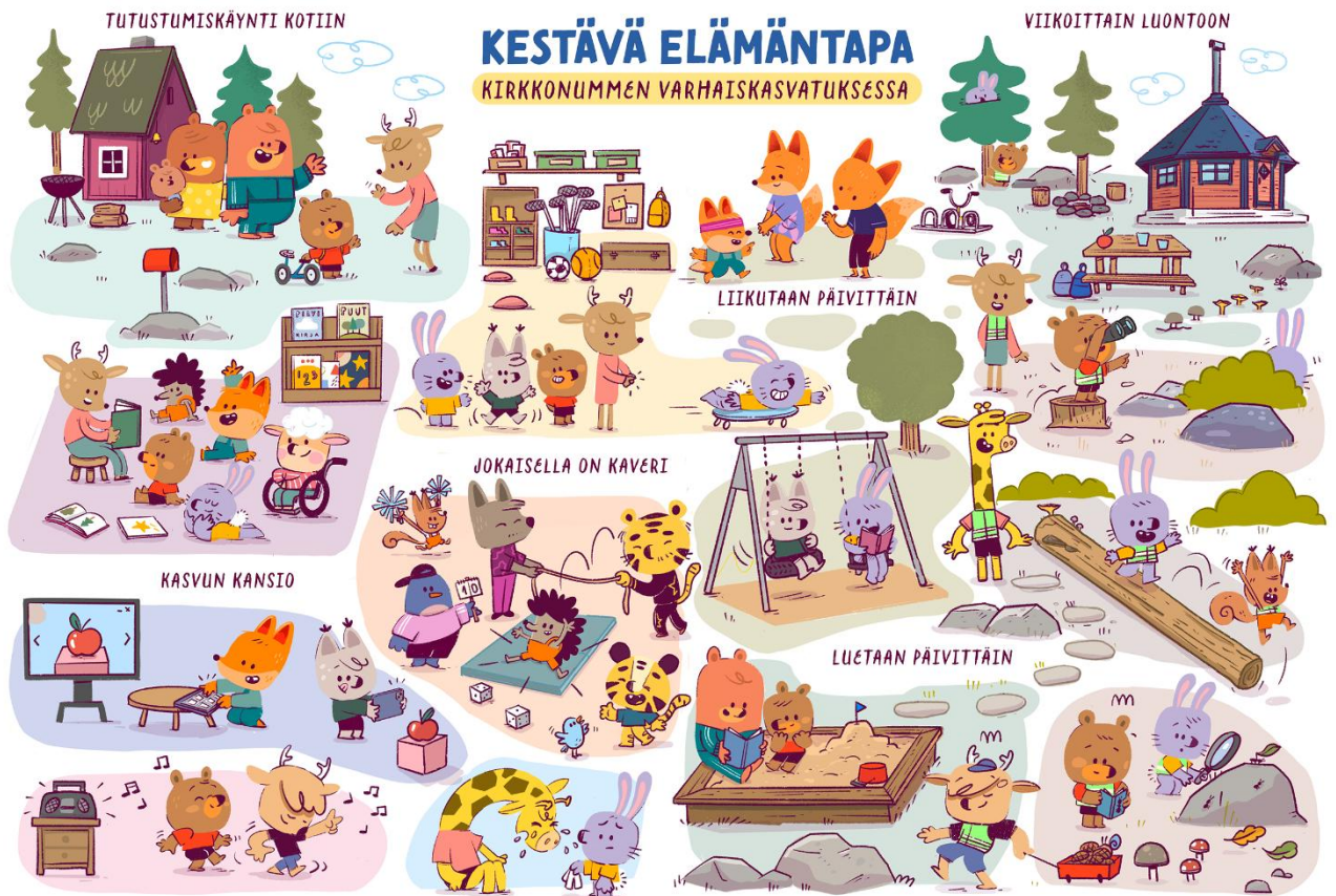
Kuvio 1. Kestävä elämäntapa Kirkkonummen varhaiskasvatuksessa ja esiopetuksessa (Laatulupaukset)