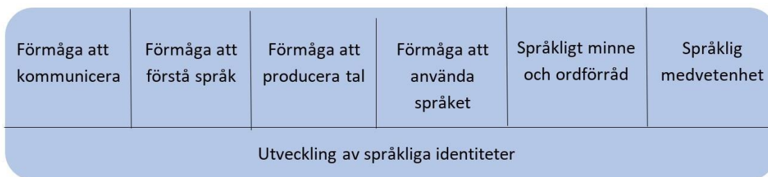
figur 2. Språkutvecklingens centrala delområden i förskoleundervisningen