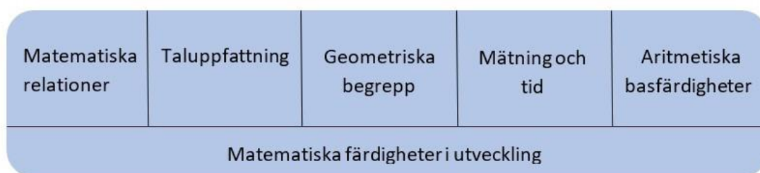
figur 3. Centrala delområden för barnens matematiska utveckling i förskoleundervisningen

Barnen ska uppmuntras att dela sina iakttagelser med varandra och på det sättet fördjupa det kollaborativa tänkandet, problemlösningsfärdigheterna och aktiviteten. Verksamheten ska planeras så att den erbjuder barnen möjligheter att lära sig och använda matematiska begrepp, klassificera, jämföra och rangordna saker och ting och att hitta och skapa lagbundenheter. Undervisningen ska omfatta lekar och uppgifter som utvecklar minnesförmågan och det logiska tänkandet. Undervisningen ska vara lekfull och man ska bland annat använda lekar, spel och berättelser samt digitala verktyg.